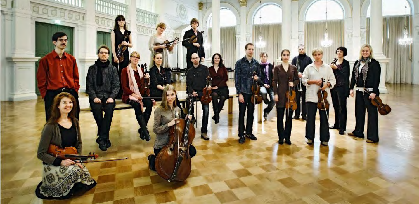
Teksti: Heikki Jokinen