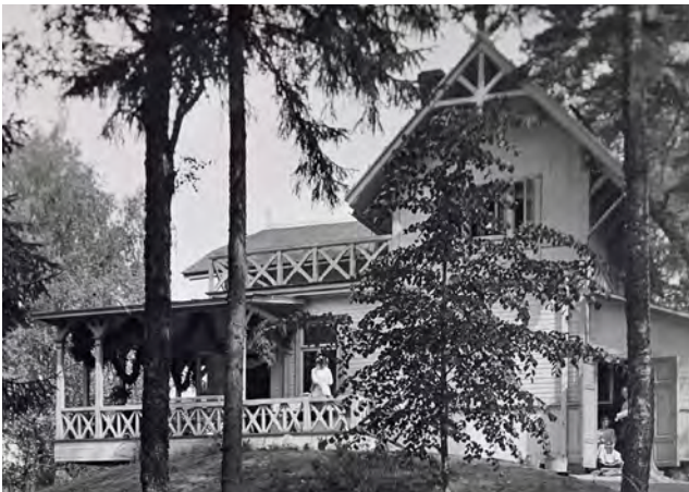
Valok. Faltin, 1900-luvun alku, Museovirasto

Kiinteistön käytön periaatteista ja käytännöstä, sen tilojen jaosta sekä kiinteistön käyttökulujen kattamisesta sovitaan erikseen residenssirahaston, Suomen Muusikkojen Liiton ja Teoston kesken. Residenssitoiminta käynnistyy heti huvilan tultua käyttökuntoon.